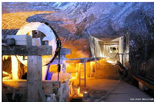
W kopalni w Wieliczce

A jeśli już o podziemnym mieście mowa – to zapraszamy na niezwykłą magiczną podróż w podziemny świat przeszłości.