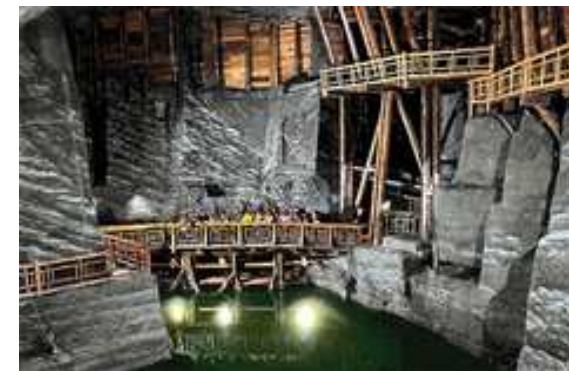
Kopalnia soli w Wieliczce

KONFERENCJA WYCENY NIERUCHOMOŚCI ZABYTKOWYCH